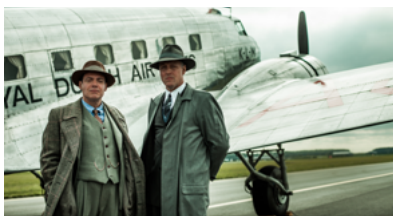
Vliegende Hollanders Topkapi/AVROTROS, 2020