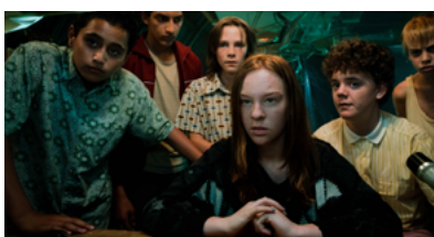
Zeven kleine criminelen Pupkin Film/VPRO, 2019