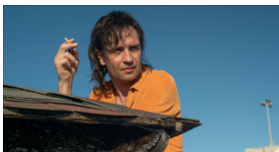
Stanley H. NL Film & TV/KRO-NCRV, 2019